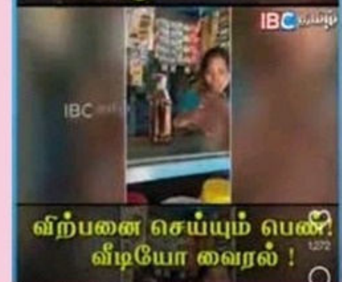
விற்பனை செய்யும் லைட் வீடியோ வரைல்!

ஆய்வாளரது சொல்லுக்கு மாவட்டத்தில் உள்ள அனைத்து காவல் அதிகாரிகளும் அலறுவது உண்டு. ஏன்னெனில் எஸ்.பி.க்கு இப்படி ஒரு தனி ஆய்வாளராக செயல்படுபவர், எதைச் சொன்னாலும் மாவட்ட உயரதிகாரியான இந்த மாவட்ட காவல் கண்காணிப்பாளர்கள் நம்புவதால், அந்த மாவட்டத்தில் உள்ள எந்த ஒரு மூத்த அதிகாரிகளும் இந்த எஸ்.பி.யின் தனிப்பிரிவு ஆய்வாளருக்கு தலைவணங்கி செல்வது உண்டு.