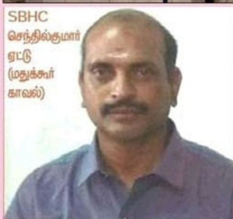
SBHC செந்தில்குமார் ஓட்டு (மதுக்கூர் காவல்)