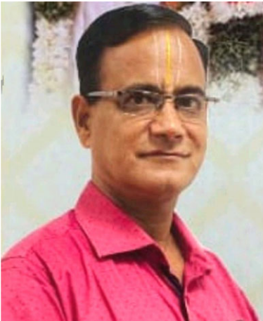
போலி சங்கர்தின் 'போலி' தலைவர் ரகு

மேலும், சாலை பாதுகாப்பு சம்பந்தமாக விபத்தை தடுக்கும் நோக்கிலும், பல்வேறு கருத்துக்களை பதிவிட்டு வருவதோடு, விபத்தை பெருக்கும் அதிகாரிகள் மீதும் என்னால் குற்றஞ்சாட்டப்படும் ஆதாரங்களோடு பல புகார்கள் கொடுக்கப்பட்டும் உரிய நடவடிக்கைக்கும் கோரி வந்துள்ளேன். இதில் சில புகார்களில் உரிய நடவடிக்கைகளும் எடுக்கப்பட்டும் அதற்குரிய தண்டனைகளும், சம்பந்தப்பட்ட அதிகாரிகளுக்கு வழங்கப்பட்டும் வந்துள்ளது