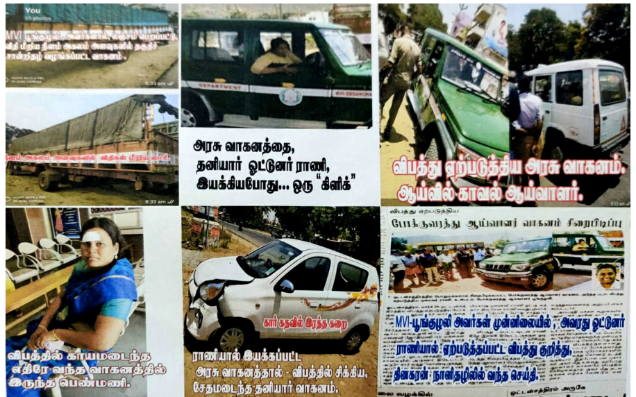
பூங்குழலியின் குற்றத்திற்கான ஆதாரங்கள்.