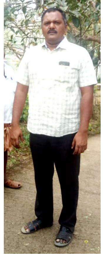
எழுட்டு வருடங்களுக்கு மேலாக ஒரே இடத்தில் கோலோச்சும் சங்கரன்கோவில் RTO அலுவலக அடாவடி டைப்பிஸ்ட்