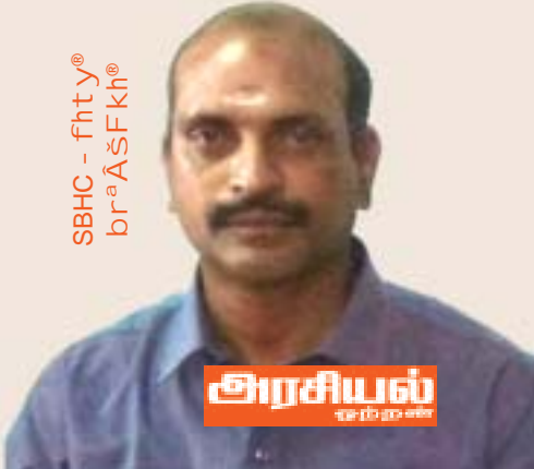
SBHC - fhty® brªĀšFkh®