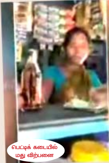
பெட்டிக் கடையில் மது விற்பனை

cj huz «j h< , j Šrhñ® khtℓl ʘÅš cŸs kJ; T® fhtš āi yakhF«. mnj neuʘÅš ĩ ŠF khtℓl SPahd utëŸĀçah IPS k%W« DIG-ahd fašé ê IPS M» nahç< mĀuoahd ne®i kahd el toji ffëš Fi w brhšy VJ« ĩ ši y v< whY«, j Ši r khtℓl SP utëŸĀçah mt®fS; j F, j äë vGj go; f bj çahj j hš, SP-Ī < ° Md j ā Ÿ ĀçĪ MĒths® kâ ntš-< gâ fŸ mi dʘĀY«, CHš fŸ k%W« mĀfhu J ZĀunahfšfS « ehS; j F ehshf v» çagona ĩ UªJ tU» wJ.