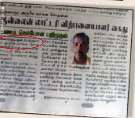
திருவாரூர் போலீஸ் கைது செய்கிறது... தஞ்சை போலீஸ் வேடிக்கை பார்க்கிறது செய்தி பார்க்க...

Šrhñ® khtEl ¢ÃŠ fy¥gl kJ é%gi dfY fdn#h®, »uhkŠfëš cYs bgfo; fi lfëš všyh« 0® é%gi dfY, nfhéš ÂUéHh; fëš ju« Fi wªj nfë; i f el dŠfY, mojo ufi sfY, ĩ UntW r_fª ÂdU; FY el; Fª bfhi yfY, mçthY bt£L; fY, fªÂ FªJ; fY,