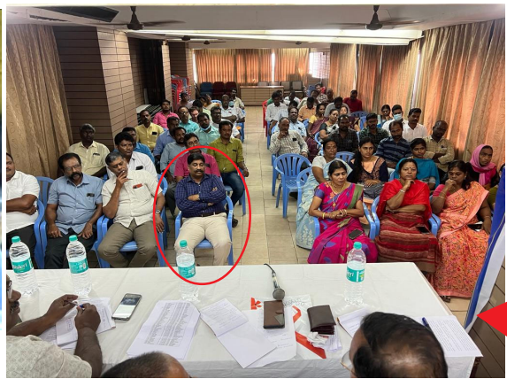
போலி பொறுப்பாளர்கள் சங்கக் கூட்டத்தில் கலந்து கொண்ட பணியாளர்கள் ரகுவின் ஆதரவாளர்கள்