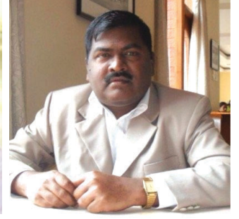
ஆணையர் நடராஜன் ஐ.ஏ.எஸ்.